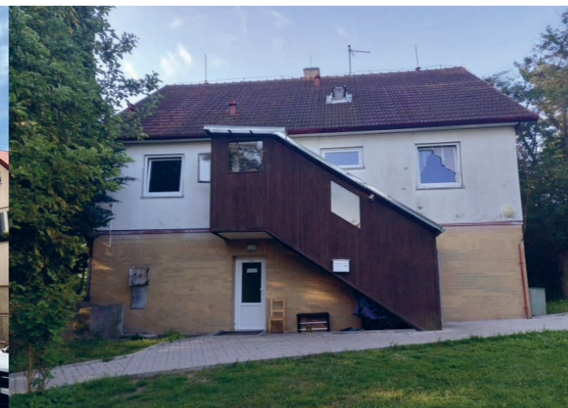
Kynšperk nad Ohří